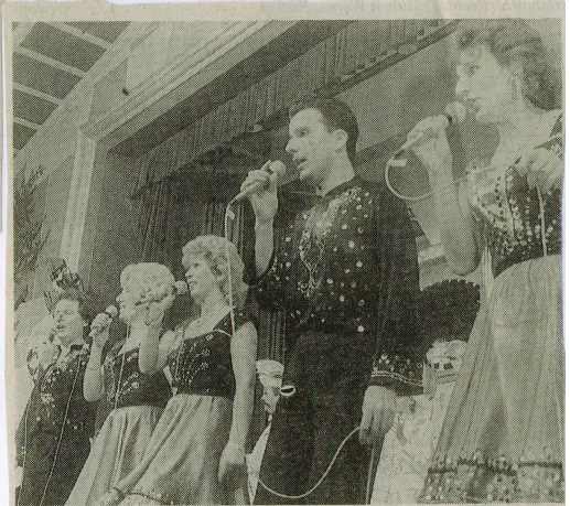
GRIESHEIM: Die Bestinos gehören mit ihren munteren Liedern zum Programm der 1. Griesheimer Carnevalsgesellschaft.